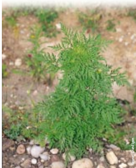
L'AMBROISIE AVANT FLORAISON